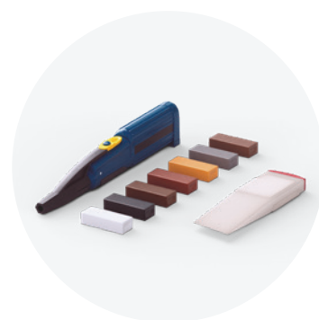
Zestaw naprawczy QSREPAIR

Wytrzymały mop z mikrofibry, który można prać w temperaturze do 60°C. Mop jest zgodny z zestawem do czyszczenia marki Quick-Step.