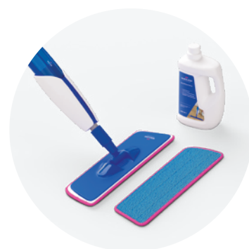
Zestaw do czyszczenia QSSPRAYKIT

Ten produkt do pielęgnacji został zaprojektowany specjalnie z myślą o podłogach marki Quick-Step. Dokładnie czyści powierzchnię i zabezpiecza jej oryginalny wygląd, dzięki czemu podłoga zawsze wygląda jak nowa.