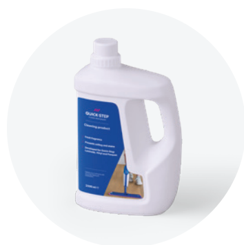
Środek do pielęgnacji 1L lub 2,5L QSCLEANING1000 QSCLEANING2500

Ten produkt do pielęgnacji został zaprojektowany specjalnie z myślą o podłogach marki Quick-Step. Dokładnie czyści powierzchnię i zabezpiecza jej oryginalny wygląd, dzięki czemu podłoga zawsze wygląda jak nowa.